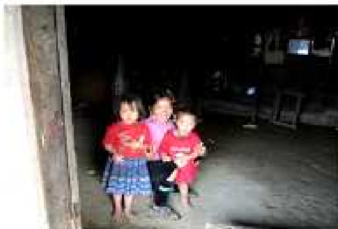
Mẹ và 2 em nhỏ